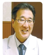
監修：岩崎 聡先生 国際医療福祉大学三田病院 耳鼻咽喉科 聴覚・人工内耳センター長 医学部教授

が難しくなることも。徐々に会話を避け、外出をやめ、引きこもりがちになってしまうケースも見られます。さらに心理的に追い込まれ、うつ症状や認知症の引き金になることもあります。聞こえの異常を感じたら、迅速な受診と適切な治療が大切です。