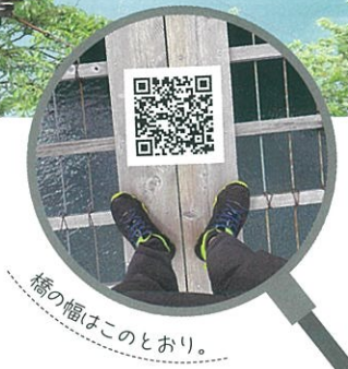
橋の幅はこのとおり。