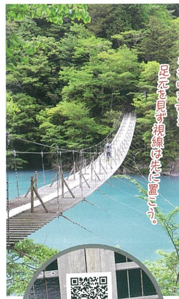
結構揺れます。足を固く視線は先に置こう。

全長90m、高さ8mの吊り橋。旅行サイトの「死ぬまでに渡りたい世界の徒歩吊り橋10選」に選定された四季折々の絶景が楽しめる。定員10人ということで混雑時には長時間待つことも。吊り橋の中央で女性が恋の成就を祈ると願いが叶うパワースポットとしても人気がある。 ④日の出から日の入りまで ☎0547-59-2746